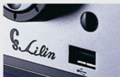
USB 隨身碟備分及升級