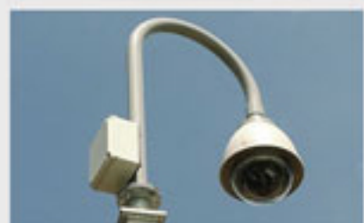
直接控制快速球型攝影機